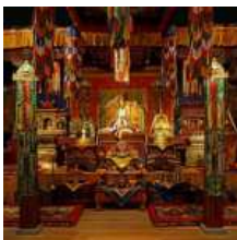
Tibetaanse tempelopstelling.

Het CBS hanteert de zogenoemde eentraps-methode om te achterhalen wie zich boeddhist noemt. Er vind geen verdere definitie plaats van het begrip boeddhist, het beantwoorden van de vraag is voldoende. Zijn dat mensen die toevlucht hebben genomen tot Boeddha, dharma en sangha? Of mensen die affiniteit met het boeddhisme hebben of bij de Blokker een boeddhabeeldje hebben gekocht? Het CBS zegt dat oordeel aan de respondent over te laten en daar dus geen inzicht in te hebben, 'we zijn zo min mogelijk sturend'. Het CBS is voorlopig niet van plan