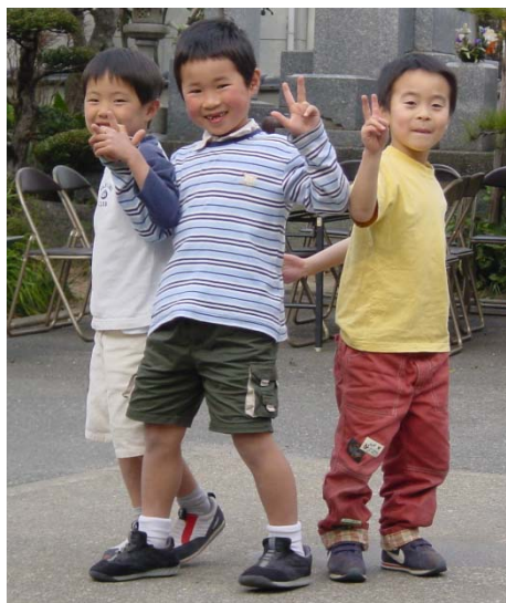
Buurtkinderen groeten tijdens het Bloemenfeest (Hanamatsuri) in Jōunji, Fukuoka – 04/04/2004