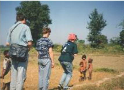
Over de dijkjes van de rijstvelden naar en van de Tweelingstupa