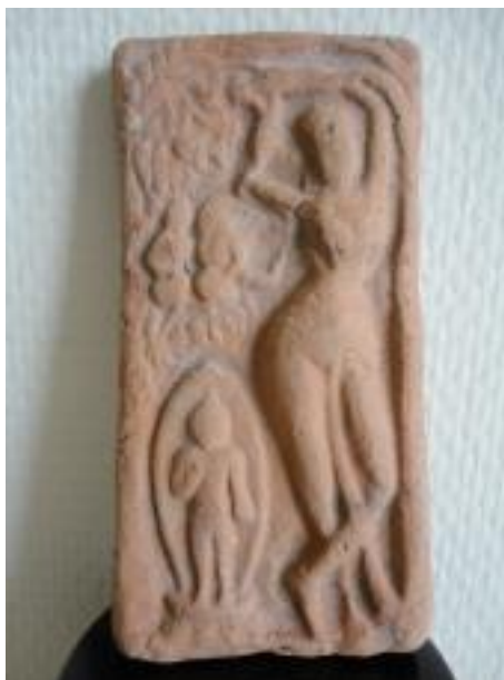
Beeldhouwwerkje dat hetzelfde tafereel uitbeeldt. Een aandenken aan mijn reis naar Nepal...

Lumbini werd al in de vijfde en zevende eeuw van onze tijdrekening beschreven door Chinese monniken. In de dertiende eeuw van onze tijdrekening maakten Malla vorsten uit het westen van Nepal een pelgrimstocht naar Lumbini. Vergetelheid ... tot in 1896 de plaats archeologisch werd gelokaliseerd na 1500 jaar onzekerheid over de ligging van Lumbini ( Wolfgang Schumann, blz-32-39 ) 4 .