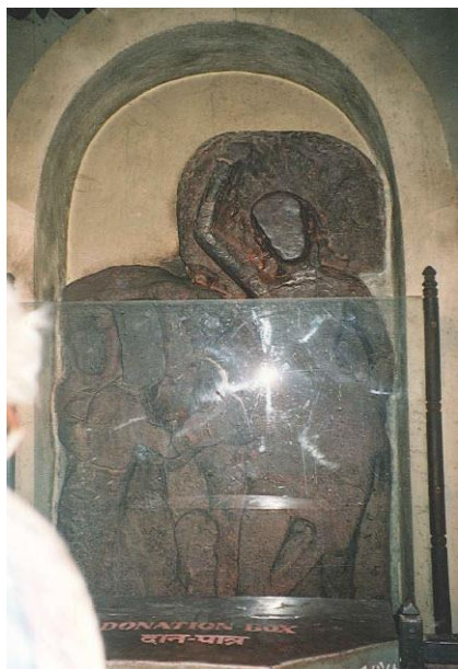
Stenen reliëf van de geboorte van Gautama. Moeder houdt zich rechtstaande vast aan een pipalboom. Jongetje staat rechtop naast moeder.