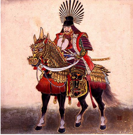
Toyotomi Hideyoshi op zijn paard

In tegenstelling tot Nobunaga, voelde hij weinig sympathie voor de christenen, waarin hij in de eerste plaats de voorhoede van Spaanse veroveraars zag. Van hem dateren dan ook de eerste antichristelijke decreten, die echter meestal niet integraal uitgevoerd werden. Om de eventuele dreiging van Spaanse scheepsartillerie af te weren, laat hij op strategisch belangrijke