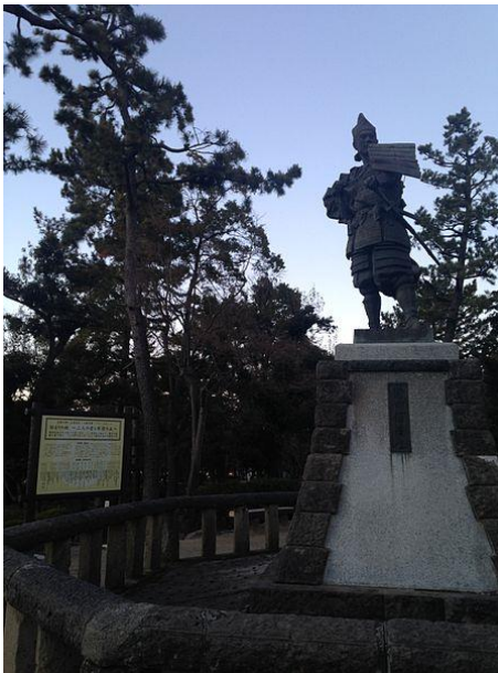
Oda Nobunaga in Kiyosu Park

Het is Jitsunyo die Ishiyama begon te voorzien van wallen en verdedigingsgrachten, en te bemannen met een gewapende militie, dat alles met de bedoeling eventuele aanvallen of pogingen tot vernieling af te weren. Maar deze machtspositie hield ook haar intrinsieke gevaren in. Ze lokte immers naar de Honganji heel wat samurai en daimyo , die slechts bij naam Nembutsu-volgers waren maar in werkelijkheid erop uit waren mee te genieten van de glans en de rijkdom van de tempel. Bovendien werd ook de band tussen Honganji en de politieke en militaire machthebbers almaar hechter.