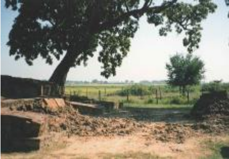
Kapilavattu I: Oosterpoort, ook genaamd Weg van het Grote Verzaken. Door deze poort verliet Gautama Sakyamuni huis en haard

paadje en de dijken van de velden naar de tweelingstupa's, vermoedelijk deze van zijn ouders ( blz 40-49 ).