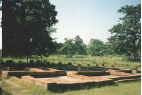
Stenen grondvlak waarop een lemen of stenen huis werd gebouwd