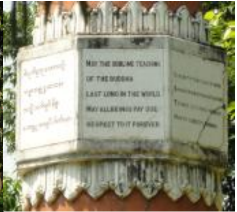
Deze zuil van Asoka bevindt zich in de Lokamani Cula Pagoda (het Myanmar Gouden Klooster, Birma) op het UNESCO-terrein in Lumbini