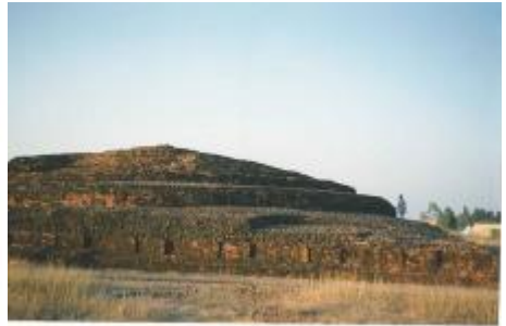
Kapilavattu II: Stupa van de Shakyas waarin zij de urne met de restasse van Boeddha bewaarden