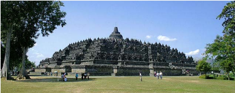
Borobudur-Nothwest-view.jpg, Gunawan Kartapranata 12/06/2008, https://commons.wikimedia.org/wiki/

Er zijn stupa's die ondersteund worden door olifanten, lotussen, boeddha's; stupa's die als grondplan een mandalapatroon hebben of in groep een mandala vormen. De stupa van Borobudur in Java (Indonesië) is daar een goed voorbeeld van. Het is een terrasvormige, afgeknotte piramide. Ze staat op een rond, drievoudig voetstuk en is bekroond met een stupa. Enerzijds zijn de opbouw en versieringen die van een mandala, een driedimensionale voorstelling van de boeddhistische kosmos. De verschillende hoogten symboliseren de verschillende werelden en bewustzijnsstadia van een spirituele evolutie. Anderzijds is het een bijzonder complexe variant van de stupa waarvan de top het eindpunt van de weg van bezinning is.