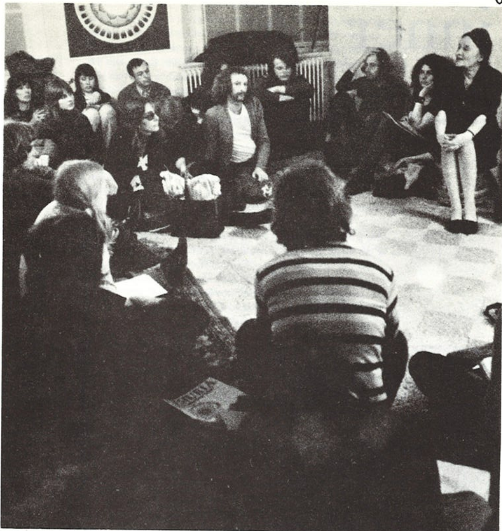
Kruiden-kursus in "de Kosmos"

Het Tchan-ondericht is er op gericht het héle leven van de ingewijde te hervormen en niet alleen een of ander aspect van dat leven.