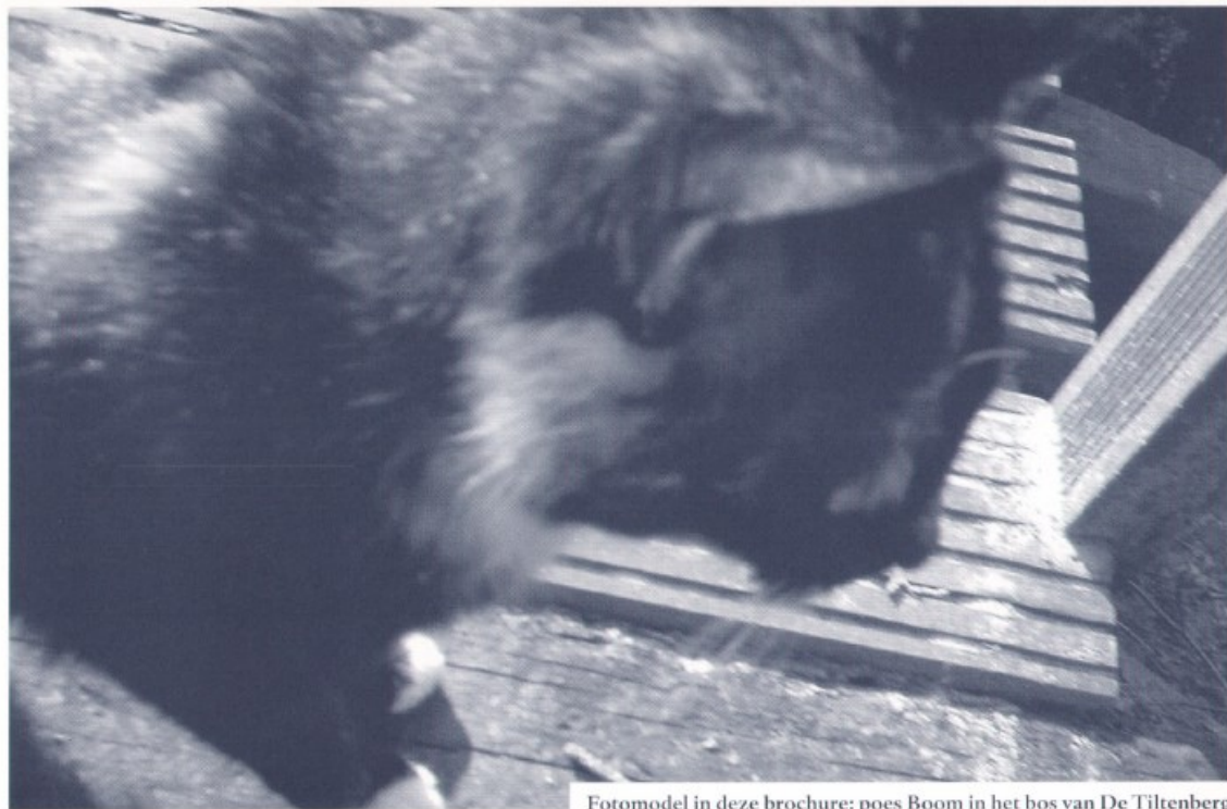
Fotomodel in deze brochure: poes Boom in het bos van De Tiltenberg