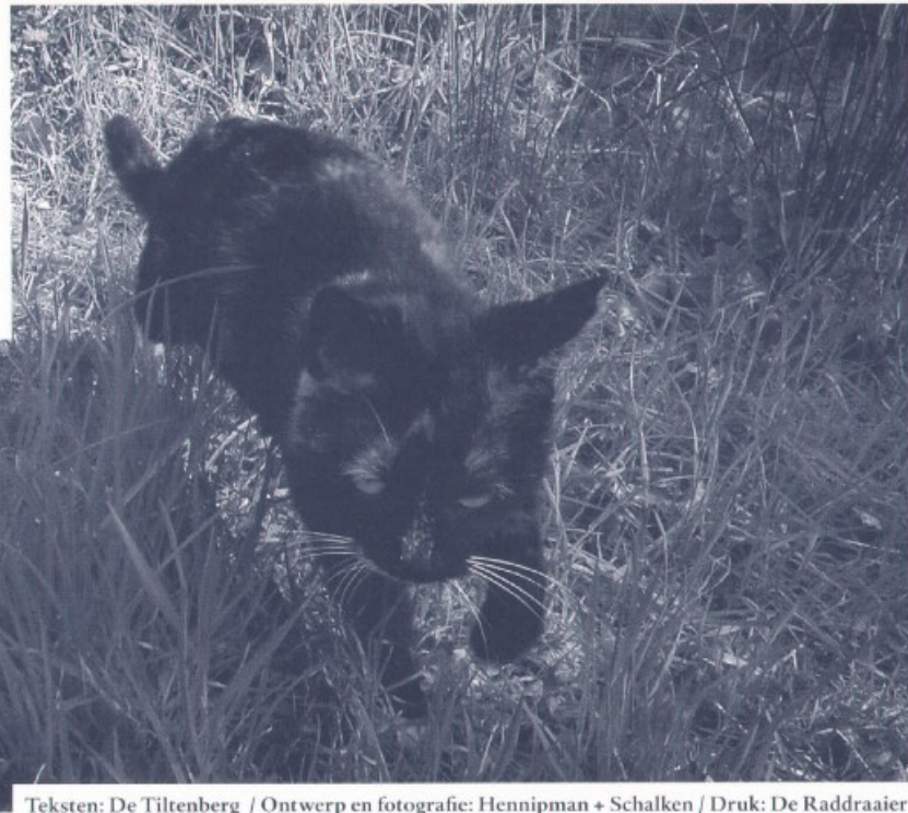
Teksten: De Tiltenberg / Ontwerp en fotografie: Hennipman + Schalken / Druk: De Raddraaier